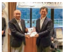
行方市ゴルフ連盟