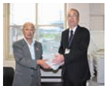
茨城県退職公務員連盟行方・潮来支部